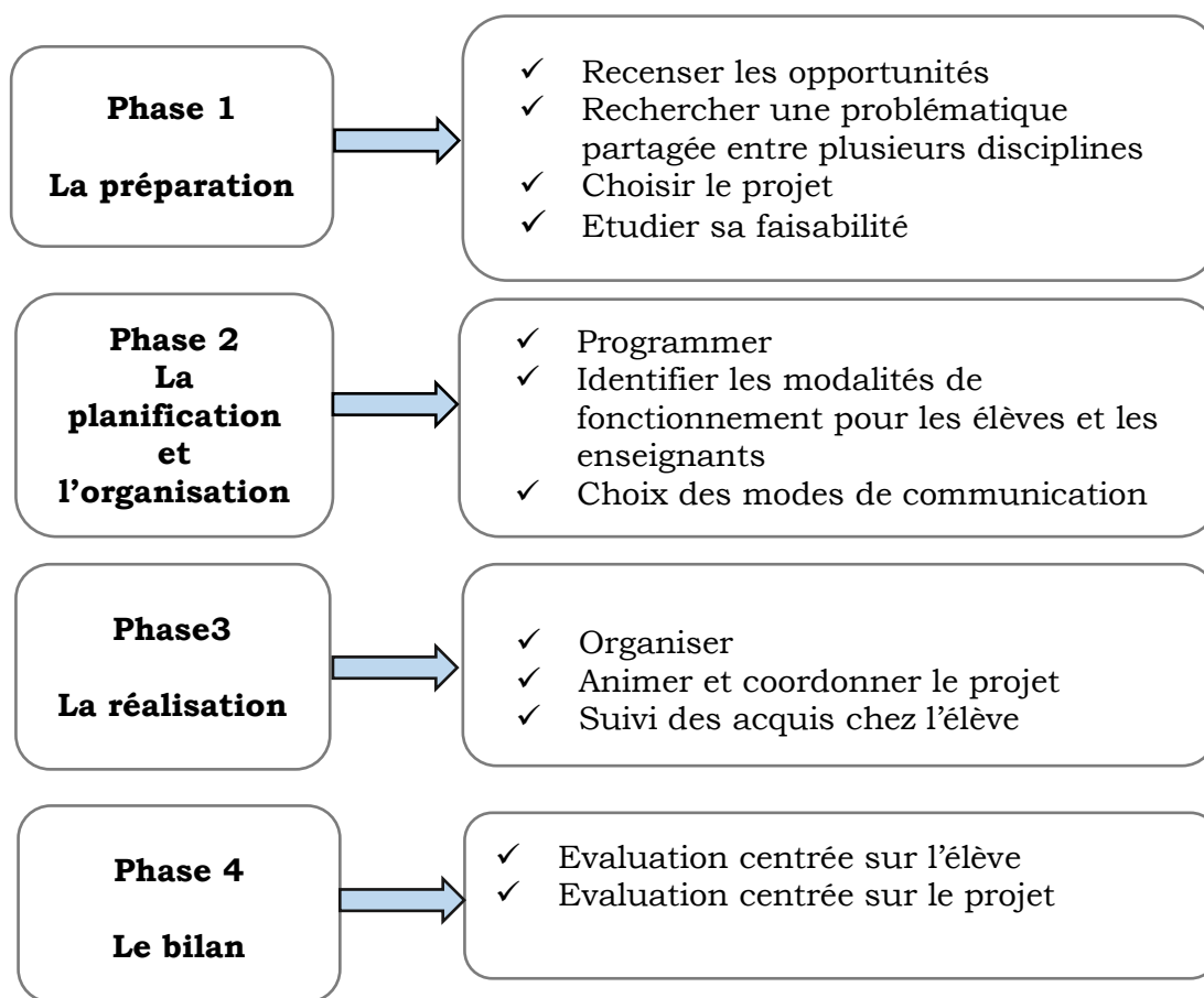
Figure 3 - Les phases d'un PPCP

Afin d'éviter de présenter le déroulement d'un PPCP au format d'un exposé nous choisissons à travers le schéma ci-dessous de démontrer ses principales étapes. Nous nous sommes aidés des documents fournis par le site Éduscol « PPCP mode d'emploi » 10