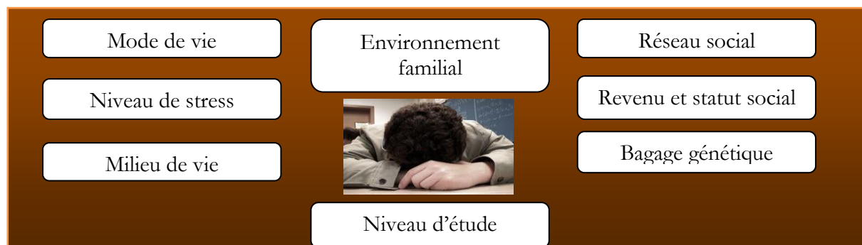
Figure 1 Facteur de santé physique et morale des individus THIBEAULT 2008 40